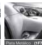
Plata Metálico (1F7)