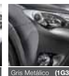
Gris Metálico (1G3)