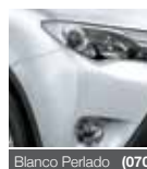
Blanco Perlado (070)