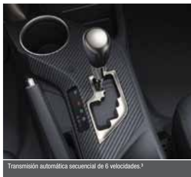
Transmisión automática secuencial de 6 velocidades. 3

1) Disponible en versión 4x4 VX. 2) Disponible en versiones VX. 3) Disponible en versiones 4x4.