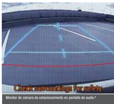
Monitor de cámara de estacionamiento en pantalla de audio. 2