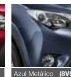
Azul Metálico (8V5)