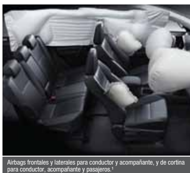
Airbags frontales y laterales para conductor y acompañante, y de cortina para conductor, acompañante y pasajeros. 1